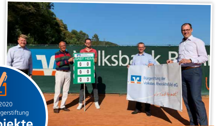
Der Tennisclub Bad Breisig erhielt eine Zuwendung zur Anschaffung einer Spielstandsanzeige für die Außenplätze.

Im Jahr 2020 hat unsere Bürgerstiftung 213 Projekte mit 134.584 € unterstützt.