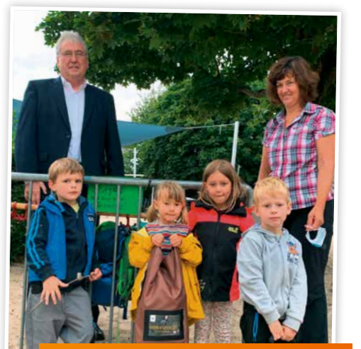
Der neu eingerichteten Waldgruppe des Kindergartens in Waldorf stellte die Bürgerstiftung zum Start ein Baumentdecker- sowie ein Bodenmentdecker-Set zur Verfügung. Beide Sets enthalten Spiele, Experimente und Aktivitäten rund um die Themen Baum und Boden.