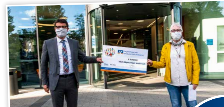
Aufgrund der Corona-Krise verzeichnete der Caritasverband Rhein-Mosel-Ahr bei seinen Tafeln einen erhöhten Bedarf an Lebensmitteln und es mussten organisatorische Vorkehrungen getroffen werden. Die Bürgerstiftung half durch eine Zuwendung, diese Herausforderung in den Ausgabestellen Andernach, Mayen und Polch zu bewältigen.