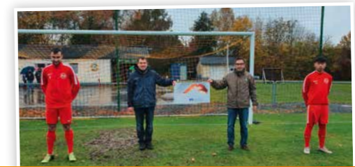
Die Spende der Bürgerstiftung nutzte die SG Alfbachtal, um durch die Corona-Pandemie weggebrochene Einnahmen zu kompensieren und den Spielbetrieb in der laufenden Saison aufrechtzuerhalten.

Kreishandwerkerschaften Ahrweiler, Mittelrhein und MEHR ihre Ausbildung absolvieren, werden mit 1.000 Euro unterstützt, wenn sie ihre praktischen und theoretischen Fähigkeiten durch einen mindestens dreiwöchigen Auslandsaufenthalt vertiefen. Anträge und weitere Informationen gibt es bei den drei Kreishandwerkerschaften.